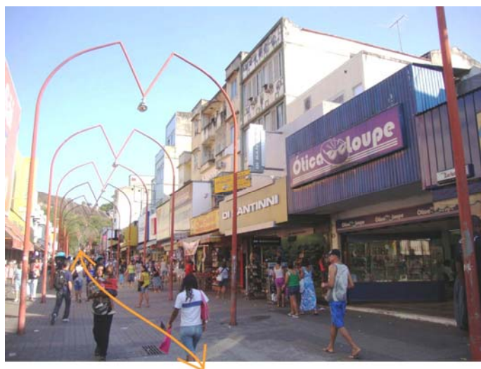
Figura 7: Principais fluxos de pedestres

Os fluxos cotidianos mais intensos aparecem na Rua dos Romeiros, devido à maior concentração comercial e à proximidade da estação (fig. 07), mas de modo geral as calçadas de toda a área são muito ativas. A área da irmandade, em contraste, é bastante vazia fora dos horários de eventos da Igreja. Os fluxos ficam restritos à população que vive na comunidade adjacente e que eventualmente a acessa pela Estrada da Penha.